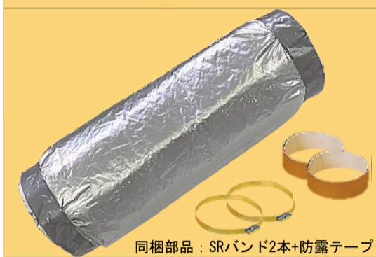
同梱部品：SRバンド2本+防露テープ